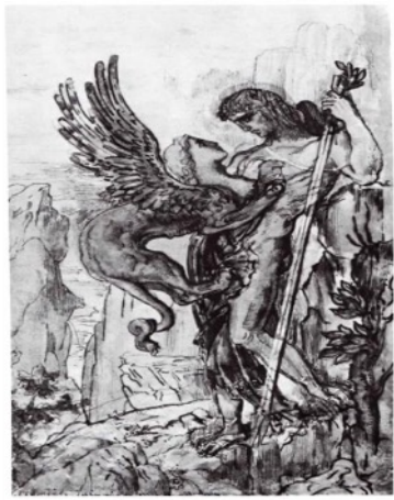
Bild 4. Gustave Moreau, Œdipe und Sphinx, 1864, Öl auf Leinwand, 206.4 x 104.8 cm, Metropolitan Museum of Art.

Hier zwei wichtige symbolistische Gemälde des Künstlers Moreau: