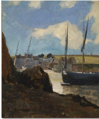
Bild 6. Odilon Redon, The Port of Morgat, 1882, Öl auf Leinwand, 26.99 × 29.53 × 1.91 cm, Dallas Museum of Arts.