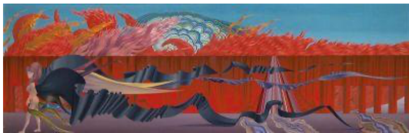
Wolfgang Hutter: Die Witwe II , Öl auf Preßplatte, 58 x 180 cm, Privatbesitz in Spanien, Datum unbekannt

Hutter stirbt am 26. September 2014 in Wien.