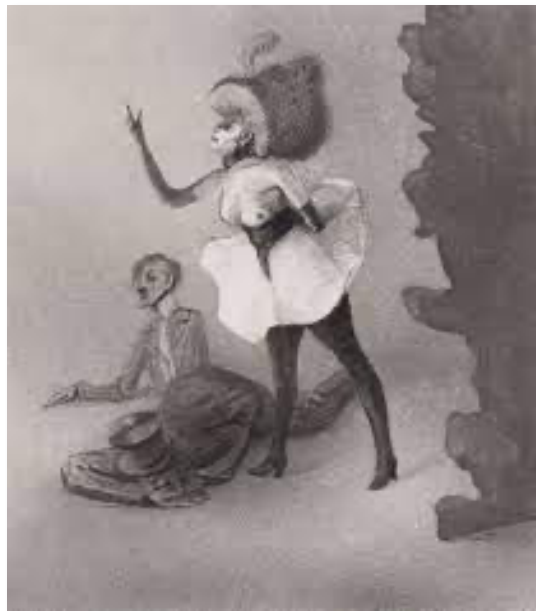
Bild 9. Alfred Kubin, Das Couplet, Feder und Tusche, 25 x 21,7 cm, Feder und Tusche, Bleistift auf Papier, Standort und Jahr unbekannt.