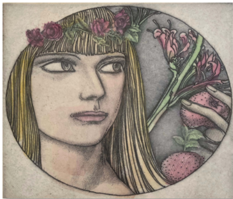
Bild 13.2. Ernst Fuchs: Sechzehn auf Eins , Farbradierung auf Papier, 39 x 24,5 cm (Blatt), 18,5 x 17,5 cm (Druck), signiert (zweimal), Auflage: 99, Nummeriert: E.A.

Nach seinen Aussagen im Buch Architectura Caelestis basieren viele seiner Themen auf visionären Erfahrungen.