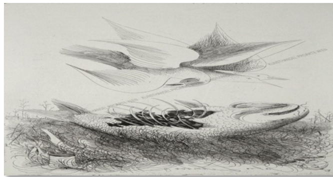
Anton Lehmden: Möwe und Fisch , Original Radierung auf Euroart-Papier mit Prägestempel

Weitere Themen sind Landschafts- und Naturkunde.