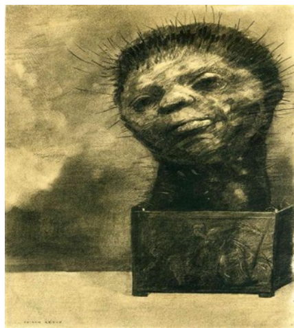
Bild 7. Odilon Redon, Cactus Man, 1881, Kohle auf Papier, 46.5 x 31.5 cm, private Sammlung.