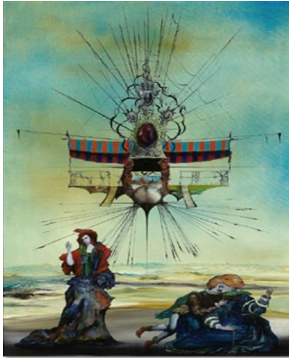
Bild 14. Peter Klitsch: Eine Phantastische Szene , Öl auf Leinwand, 100 x 70 cm (39,4 x 27,6 in), 1975, Wien.