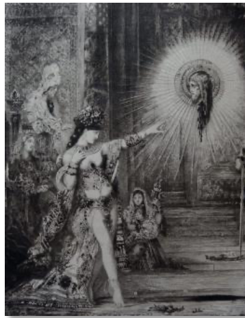
Bild 5. Gustave Moreau, L'Apparition (Die Erscheinung / Salome), 1876-77, Öl auf Leinwand, 55.9 x 46.7 cm. Harvard Art Museums/Fogg Museum.

Quelle: ( https://harvardartmuseums.org/collections/object/299926 ) 18.1.2022