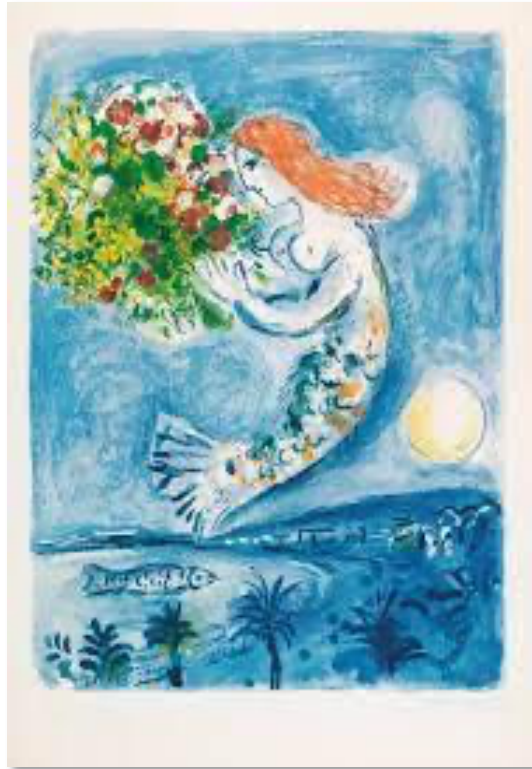
„La Baie des Anges“, 1962, Farblithografie auf Arches, signiert Marc Chagall, Nr. 17 aus der Edition von 50 Exemplaren, Darstellungsgröße 77,5 x 57,4 cm, Blattgröße 91 x 64,8 cm, Mourlot 350, gerahmt

Arik Brauer, In Würde , 2008, Öl auf Hartfaserplatte, © Arik Brauer, Wien/Sebastian Gansrigle Quelle: ( https://linossartstory.com/2021/01/25/arik-brauer-sie-ham-a-haus-baut/ ) 4.2.2022