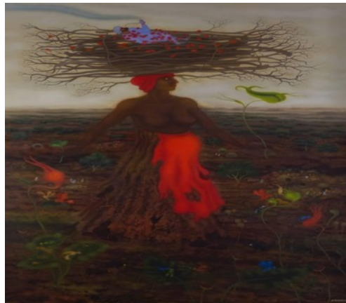
Arik Brauer, In Würde, 2008, Öl auf Hartfaserplatte

Brauer starb am 24. Jänner 2021 im Alter von 92 Jahren in Wien.