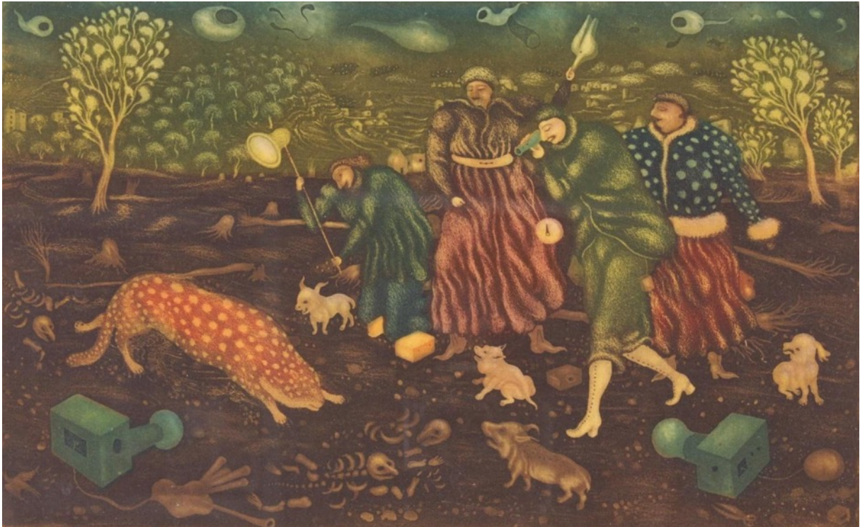
Bild 2. Arik Brauer, Der letzte Leopard, 1976, Original-Farbradierung, 22 cm x 34 cm.