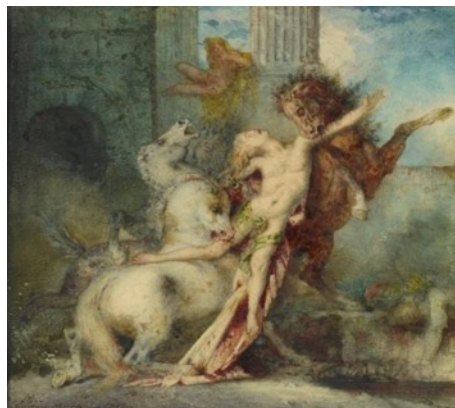
Bild 3. Gustave Moreau, Diomedes Devoured by Horses (Diomedes von Pferden gefressen), Watercolor over graphite 21.4 × 19.7 cm, Öl auf Leinwand, the J.Paul-Getty-Museum, 1866.

Der Symbolismus wandte sich vor allem gegen den Realismus. Die jungen Künstler wollten den herrschenden naturalistischen Maltraditionen nicht entsprechen. Sie bevorzugten, eine eigene Kunstwelt zu erschaffen, die der Realität nicht entsprach. Die Themen und Handlungen, die zumeist in den Werken der Symbolisten auftraten, waren Tod und Erotik, Sünden und Leidenschaften.